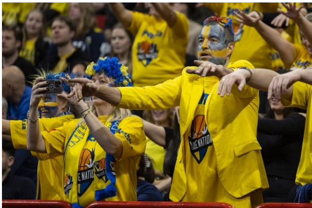
Avicci Arena februari